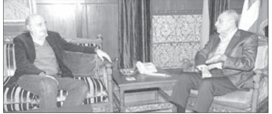
الرئيس نبيه بري مستقبلاً النائب وليد جنبلاط في عين التينة

مدخله يافطة كبيرة كتب عليها، بالأحرف العربية واللاتينية، لفظة «... مُول» مسبوقة باسم المكان المقتصب، لم تُثر فيه الصورة مشاعر الانبهار، كما يحصل لبعض أترابه من الزائرين، فقد ملّ في غربته من تكرار المشهد المستنسخ، أينما توجه، وكيفما استدار، في أسواق شيدت أروقها من زجاج هش، وأضواؤها من زيت كالح السواد. تمنى المسافر لو أن في «المول» منتجاً واحداً من صنع بلاده ليبتاعه، ولكن، وأأسفاً، لا تؤخذ الدنيا بالتمني.. فقصّد زاوية يُقدم فيها الطعام والشراب، واقترب من رجل مسنّ يجلس وحيداً، ويحتسي قهوته وذهنه شارد في مكان بعيد، فاستأذن منه الجلوس على الكرسي الخالي بجانبه، ثم خاطبه بهدوء: «أرجو أن لا أكون قطعت عليك سراح فكري»،