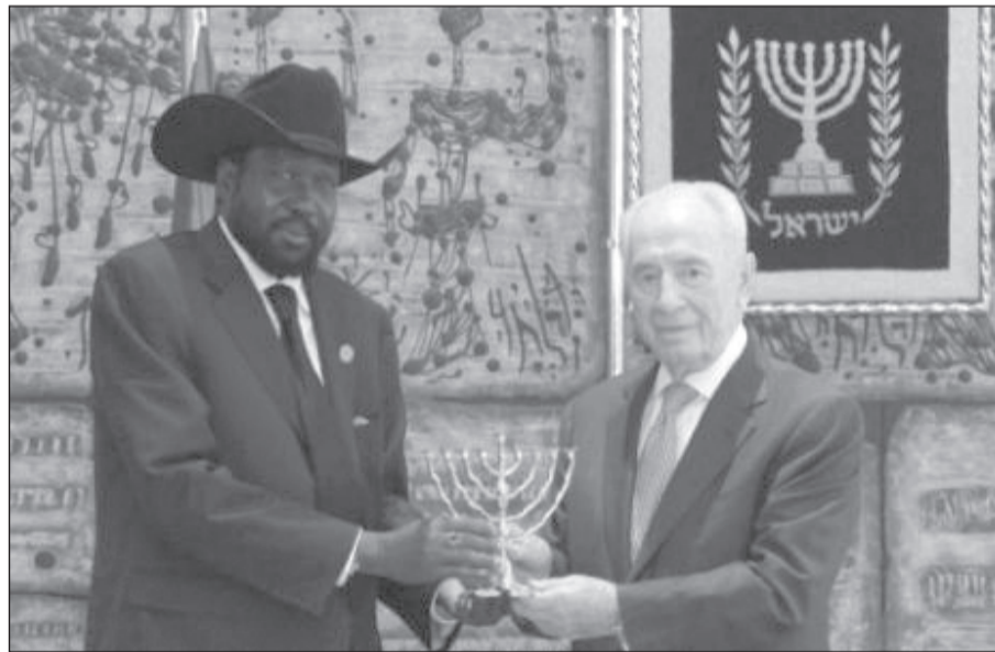
شيمون بيريز وسيفاكير في القدس المحتلة

خلص مشروع «ترعة السلام» إلى أن حصص المياه التي تقررت لبلدان حوض النيل ليست عادلة، وذلك لأنها تقررت في وقت سابق على استقلالهم، وأن «إسرائيل» كغالبية بأن تقدم لهذه الدول التقنية التي تملكها من ترويض مجرى النيل، وأوضح ارنون سوفير؛ الأكاديمي في جامعة حيفا، في كتاب له بعنوان «الصراع على المياه في الشرق الأوسط»، أن «إسرائيل» مصالح استراتيجية في حوض النيل، وأن توزيع المياه بين دول الحوض يؤثر مباشرة على «إسرائيل» ولذلك