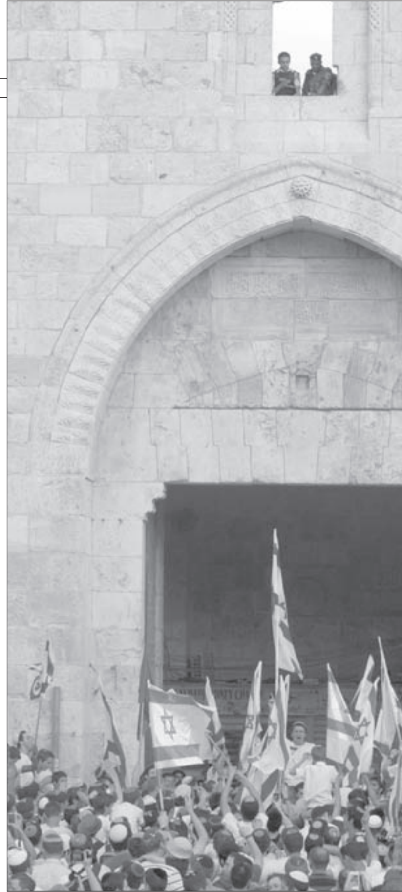
مجموعات صهيونية متطرفة تحاول الدخول إلى الأقصى عبر «بوابة دمشق»