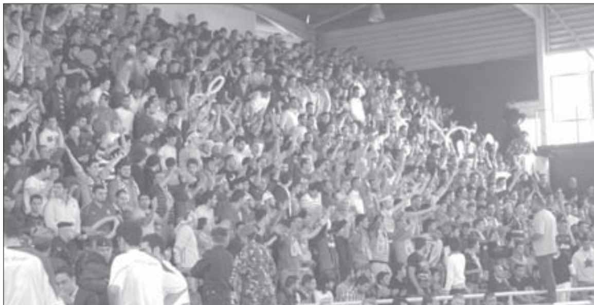
جمهور اللعبة يخشى من أن تنعكس الخلافات على البطولة الملتهبة