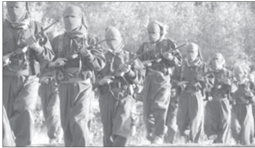
مقاتلون من «حزب العمال الكردستاني» خلال استعراض عسكري قبل الانسحاب من الأراضي التركية

2- عودة توتير العلاقات بين تركيا ودول جوارها: سورية والعراق وإيران وروسيا ولبنان، مما أثر سلباً