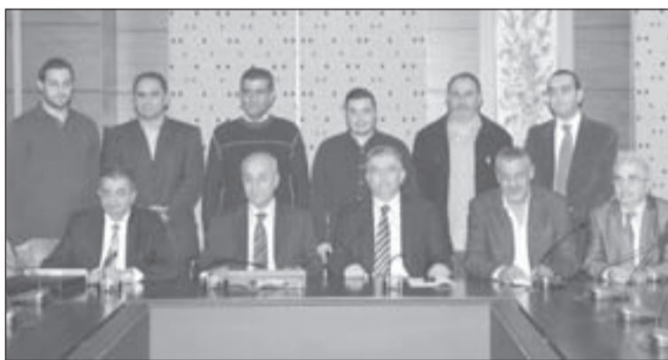
الاتحاد اللبناني لكرة السلة