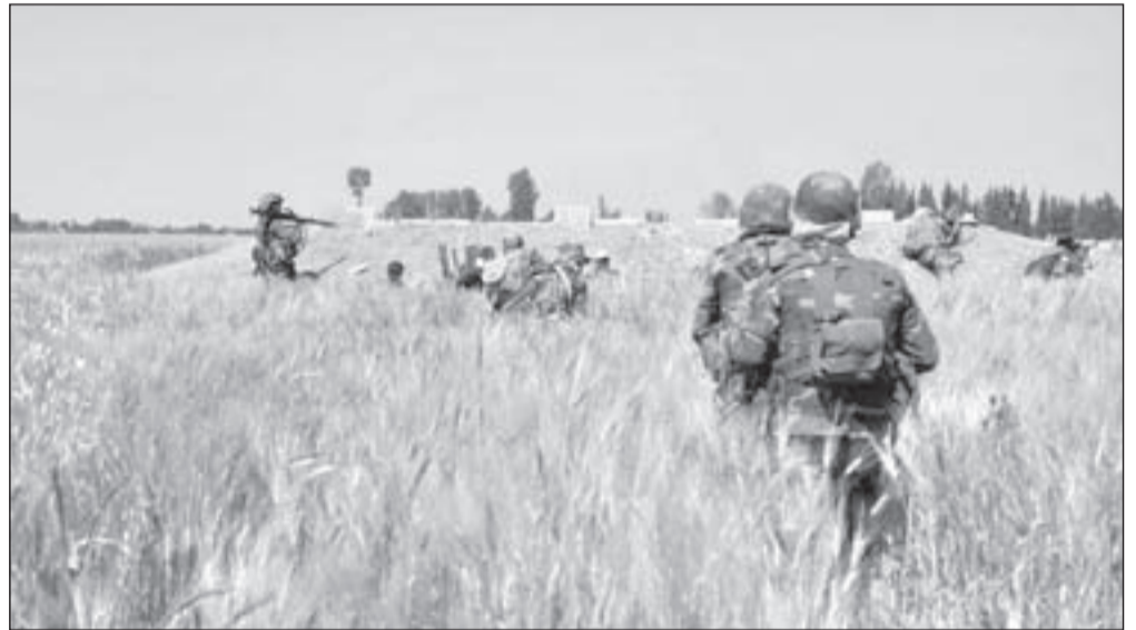
عناصر من الجيش العربي السوري تلاحق المجموعات المسلحة في الغوطة الشرقية

لكن المشكلة الأساس تتمثل في مسألة حماية الكيان الصهيوني وتصفية القضية الفلسطينية، ومشكلة اللاجئين والوطن البديل، حيث إن ما تريده «إسرائيل» من كل ما يسمى «الربيع العربي» هو كيفية إبقائها الدولة الأقوى في المنطقة، وإسكات المقاومة بشكل عام، وإغلاق جبهة غزة، وتحييد حركة «حماس» وتدجينها خليجياً، بعدما تم إسكات حركة «فتح» بعد اتفاقيات أوسلو.