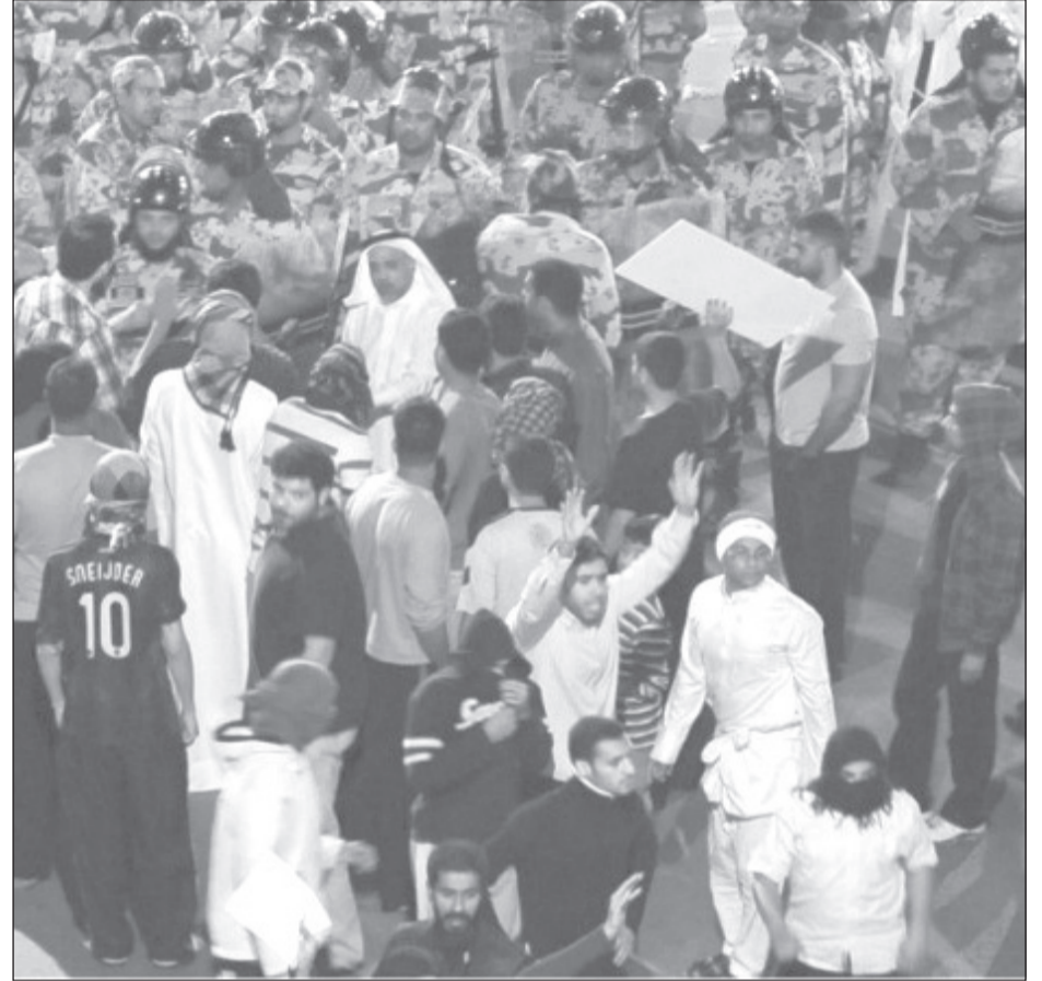
الأمّن السعودي يواجه مظاهرة خرجت في العاصمة للمطالبة بالإصلاحات

هذه القضية ليست وحدها ما يقلق النظام ورعاته الخارجيين، لا سيما في الولايات المتحدة، رغم أن العائلة الحاكمة تحاول طمأنة منتقديها، من خلال محاكمات صورية قراراتها مسبقة الصنع، وبغياب أي محام للدفاع، وفي الحقيقة منع المتهمين من تعيين محامي دفاع، خصوصاً مع تهمة مخزية لتظاهرين جل ما طالبوا به، المساواة والعدالة ووظائف وإصلاحات ووقف التمييز الطائفي وتطبيق القوانين، وكذلك عدم إبلاغ أهالي المعتقلين بتعسف قُل نظيره بمواعيد