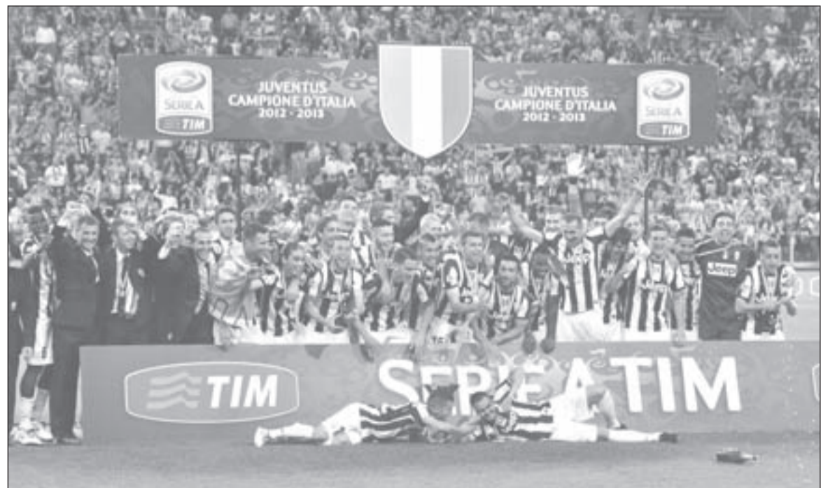
فرحة فريق جوفنتوس بلقب الدوري الإيطالي

واكتفى جوفنتوس بلعب دور المتفرج بعد عودته إلى «سيريا A»، حيث شاهد الإنتر يتوج باللقب خمس مرات متتالية