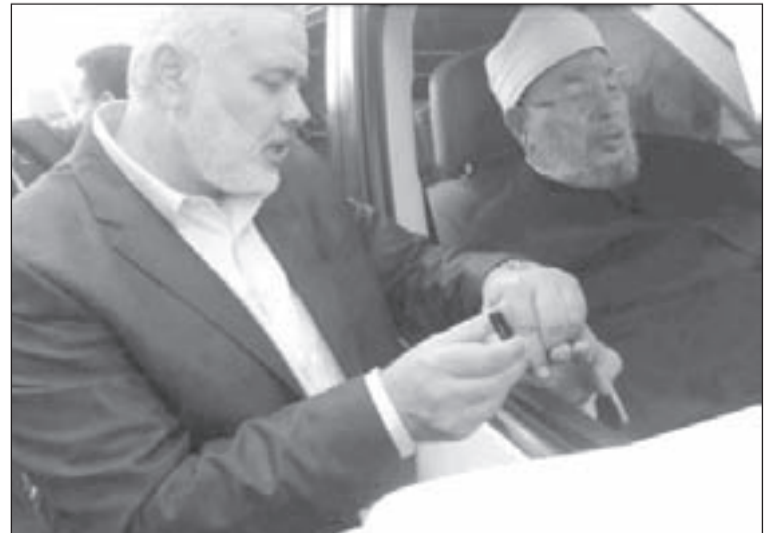
هنية يقلّم أظافر القرضاوي

بالسيد إسماعيل هنية؛ رئيس الحكومة في غزة، في إظهار سعادته بقدوم الشيخ يوسف القرضاوي إلى غزة. المبالغة المشار إليها لم تقتصر على سلة الأوصاف التي أسبغها هنية على القرضاوي وحسب، بل وجدت تعبيراً «حسبياً» آخر تمثل في تقبيل يد الشيخ جيئة وذهاباً، فلم يظهر هنية إلا وهو يلثم يد شيخه. في كل حال، السيد هنية حر في أن يلثم يد من يريد، هذا يندرج في موقع الحرية الشخصية (التي لم تحترمها شرطة هنية وهي تقمع مسيرة شعبية خرجت للتنديد بالعدوان الصهيوني على سورية)، لكن أن يزعم رئيس الحكومة أن غزة تتشرف بزيارة القرضاوي، فهذا مما لا يحق له، كونه ليس رأي القطاع وأهله، وإذا كانت شرطة «حماس» قد منعتهم من التعبير عن رأيهم، فقد قاله الفلسطينيون في العديد من مدن الضفة والأراضي المحتلة عام 1948.