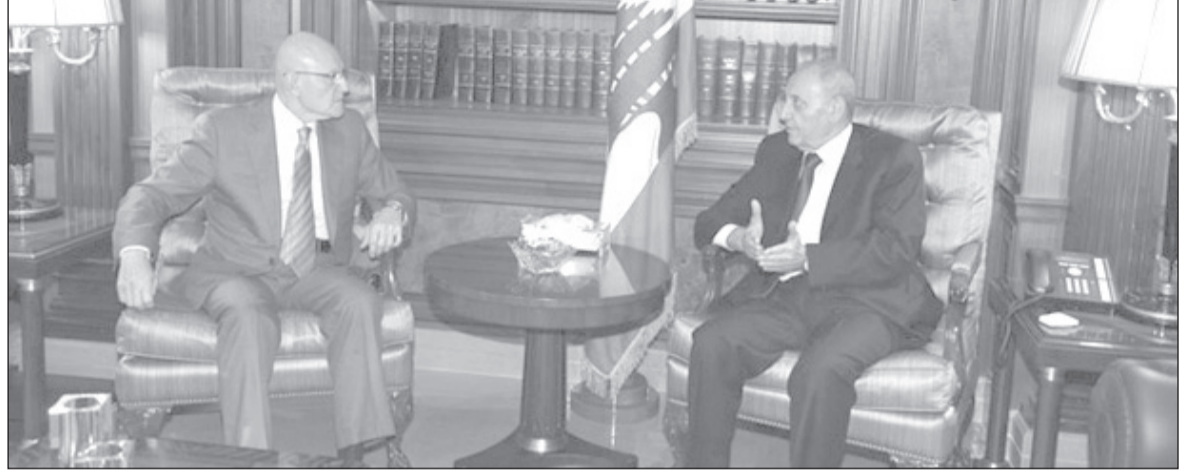
الرئيس نبيه بري مستقبلاً الرئيس المكلف تمام سلام في عين التينة

الأكثرية النيابية المتوجهة لإقرار «مشروع القانون الأوثوكسي»، تؤخر تنفيذه.