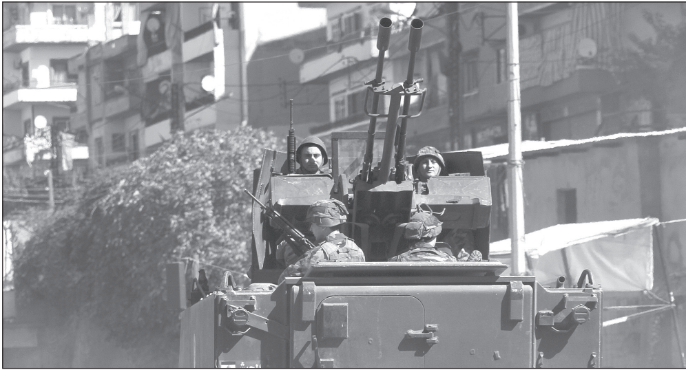
دبابة للجيش اللبناني عند أحد المحاور الفاصلة بين باب التبانة وجبل محسن

إذا سارت أمور الحكومة الجديدة على ما يرام، فيكون الرئيس تمام سلام الرقم 31 في نادي رؤساء الحكومة منذ العام 1926، والرقم 26 في نادي رؤساء الحكومات منذ الاستقلال عام 1943، والثالث الذي يرث والده برئاسة الحكومة، حيث ترأس الرئيس رشيد كرامي الحكومة لأول مرة عام 1955، بعد أن كان والده الزعيم الوطني عبد الحميد كرامي ترأسها عام 1944، والرئيس عمر عبد الحميد كرامي الذي ترأس الحكومة لأول مرة عام 1991، والرئيس سعد الحريري الذي ترأس الحكومة للمرة الأولى عام 2009 بعد والده الرئيس رفيق الحريري.