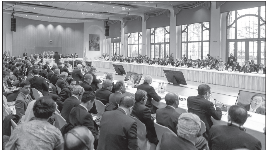
الوفود المشاركة في مؤتمر «جنيف - 2» خلال جلسة الافتتاح

قد تطول مدة مؤتمر «جنيف - 2» أو تقصر، لكن السؤال الملح: هل سيتوصل إلى نتيجة حاسمة؟ المثل العربي هنا يدل بوضوح على واقع الحال: «المكتوب يُقرأ من عنوانه»، فالدمية التي تحتل مركز الأمانة العامة للأمم المتحدة واسمها بان كي مون، قد تكون «باريسي» فاعلة أكثر منه عالمياً، على الأقل على