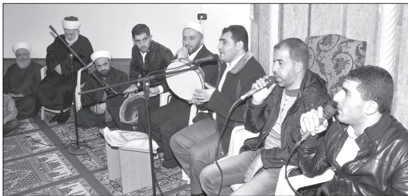
فرقة «ربيع النور» الحلبية تشد بذكرى المولد النبوي