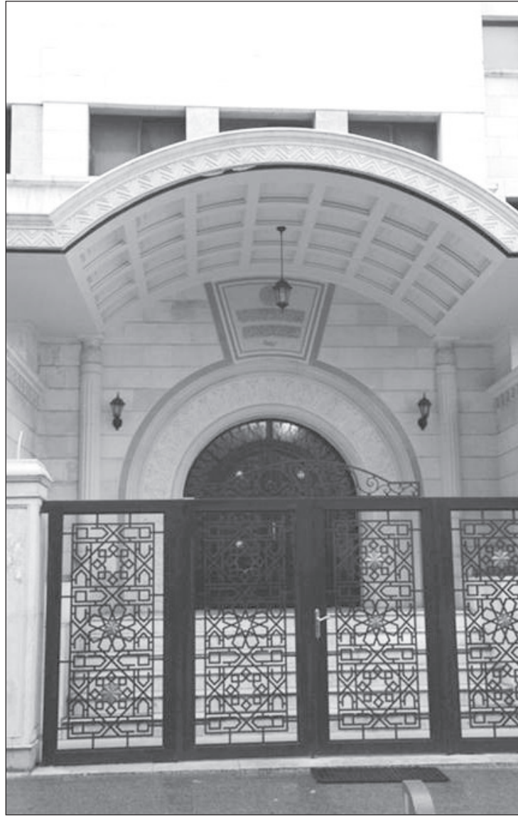
مدخل مبنى دار الافتاء

ولكن هذه الفكرة لم تتحقق بسبب وفاة الرجلين صاحبَي هذا المشروع، وفي سنة 1370هـ (1950م)