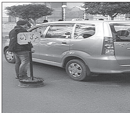
توزيع الحلوى في منطقة المصيطبة بمناسبة المولد النبوي الشريف

لمناسبة ذكرى المولد النبوي الشريف وأسبوع الوحدة الإسلامية، أقامت «حركة الأمة» حواجز محبة في الشوارع الرئيسية للعاصمة بيروت، وزعت خلالها الحلوى والهدايا على المواطنين، وسط صوت الأناشيد والمدائح النبوية الشريفة. وأكدت «الحركة» أن مناسبة مولد النبي محمد صلى الله عليه وآله وسلم هي مناسبة جامعة لكل اللبنانيين، داعية المسلمين جميعاً إلى الوحدة ووآد الفتنة ونبت التعصب، وسائلة الله عز وجل أن يعم الاستقرار لبنان وسائر بلاد العرب والمسلمين.