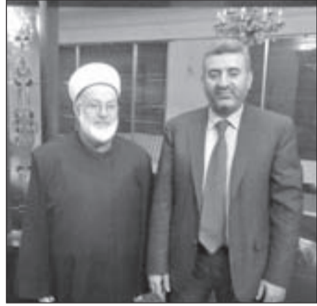
الشيخ جبري ود. علي الدليمي في السفارة اليمنية في بيروت