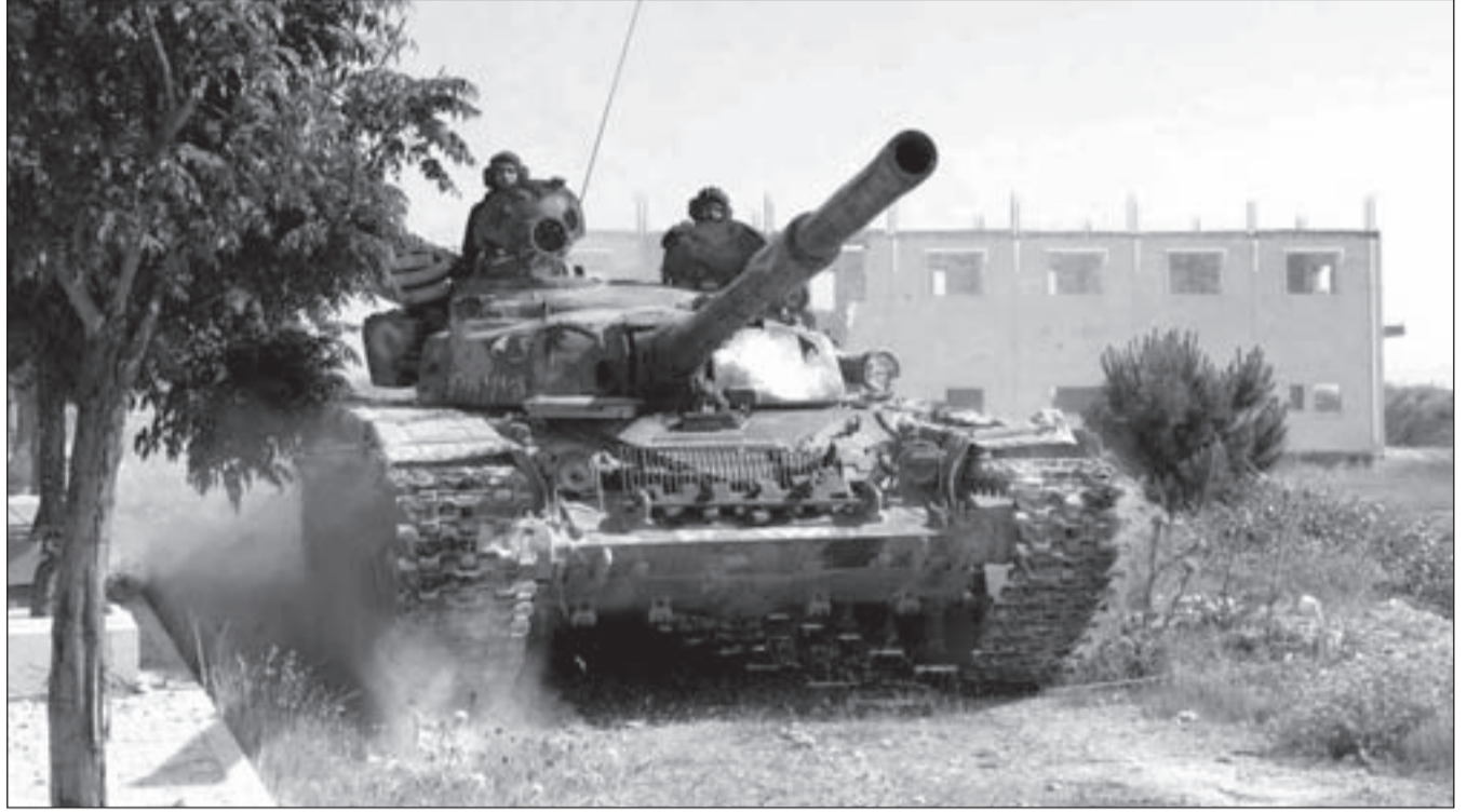
دبابة سورية تدك معقل المسلحين في ريف دير الزور

لم تنفع معها كل المقويات الأميركية والصهيونية والخليجية والتركية، فلم يبق أمامهم سوى إطالة أمد الحرب، بمختلف الأشكال والوسائل التي تميزت مؤخرا بارتفاع الضجيج السعودي - التركي عن التدخل العسكري المباشر من خلال توفير 150 ألف مقاتل يحشدون بتمويل سعودي لمهاجمة سورية، تحت عنوان «مقاتلة داعش»، وفي هذا كذبة كبيرة، لأن وجود «داعش» وانبعائها لم يعد يخفى على أحد.