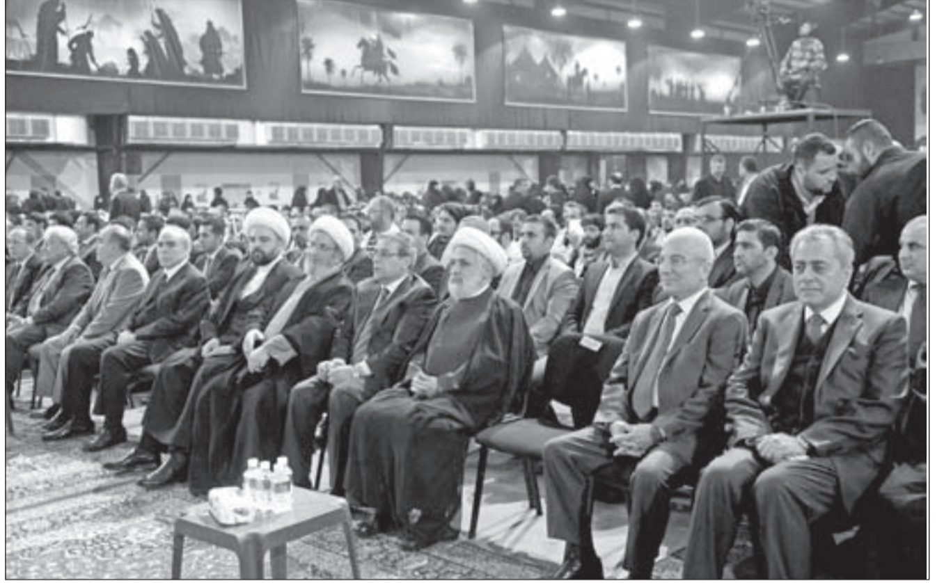
مقدمة الحضور في احتفال القادة الشهداء

و«داعش» خياراً أفضل من نظام الرئيس بشار الأسد، الذي كان وما زال وسيبقى من خلال موقعه في محور المقاومة، يشكل خطراً على المشروع الصهيوني، وعلى مصالح «إسرائيل» في المنطقة، ولذلك تتلاقى المصالح والأهداف مع تركيا والسعودية بإفشال أي حل يؤدي إلى بقاء الرئيس الأسد ونظامه، حتى لو حصلت تسوية أو مصالحة وطنية، ولهذا هم يضعون شروطاً ويرفعون السقوف التي لم تعد مقبولة حتى عند الأميركيين والأوروبيين، ببساطة فهؤلاء لا مانع لديهم باستمرار الحرب في سورية لأن أي مصالحة ستكون خطراً عليهم.