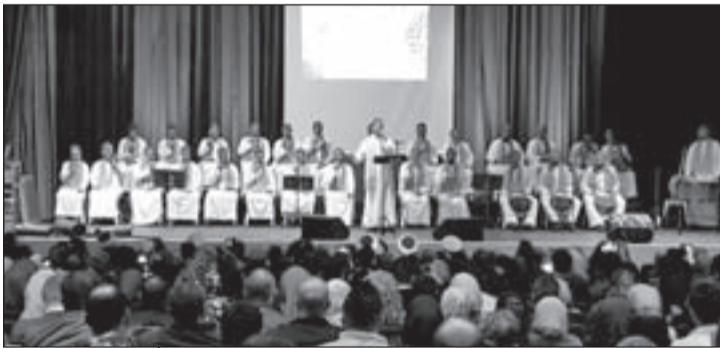
الفرقة اللبنانية لإنشاد الترات، خلال تقديم باقة من الأناشيد