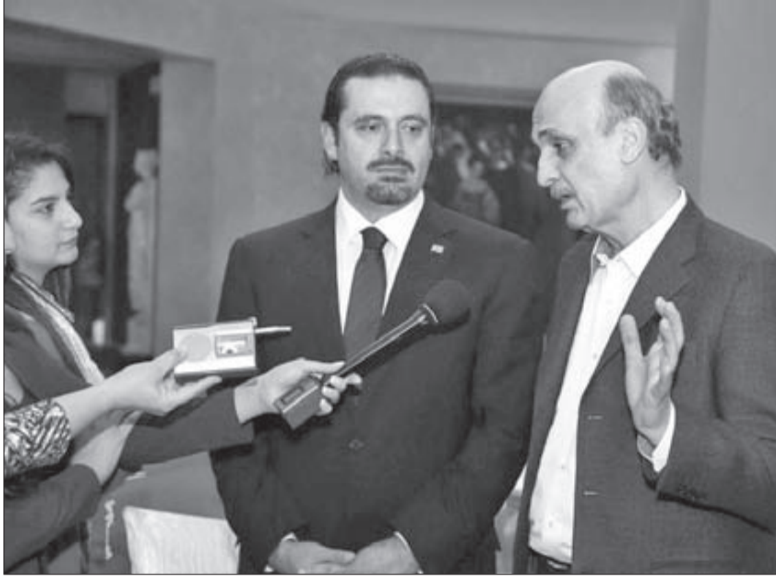
قرار سعودي بعدم فرط تحالف «14 آذار»... بالرغم من كل التصدعات

السعودي عموماً، وعدم امتلاكه الخبرة الكافية للانتصار في حرب بريّة، وأنه امتك فقط تفوقاً عسكرياً جويّاً على اليمنيين، لكن هذا التفوق الجوّي في اليمن لا يقارن بما يملكه الروس من سلاح جوّي استطاعوا من خلاله فرض سيطرتهم وتفوقهم حتى على نظرائهم الأوروبيين فوق سورية. في الواقع، فإن حرب اليمن تلك كشفت أن المملكة خلال تاريخها لم تبن جيشاً سعودياً قوياً، إما لاتكاليها على الاتفاقيات المعقودة مع الأميركيين لحفظ أمن المملكة، أو لأن الأسرة الحاكمة خشيت من أن يتكرر