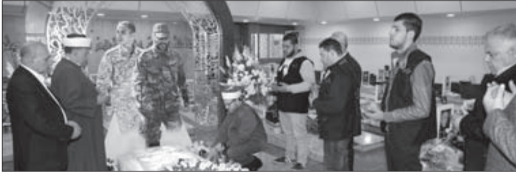
وفد «حركة الأمة» يقرأ الفاتحة عند ضريح الشهيد عماد مغنية

أشار فيها إلى أن ما تقوم به المقاومة اليوم هو لدرء الخطر عن لبنان، والدفاع عن جميع اللبنانيين، ومعادلة الجيش والشعب والمقاومة أثبتت فعاليتها لحفظ الأمن والتصدي للعدو الصهيوني والمجموعات الإجرامية، مؤكداً أن هذه المعادلة هي درع الوطن، وستلحق الهزيمة بأي معتد يحاول استهداف القرى والبلدات اللبنانية، سواء على الحدود الجنوبية أو الحدود الشرقية.