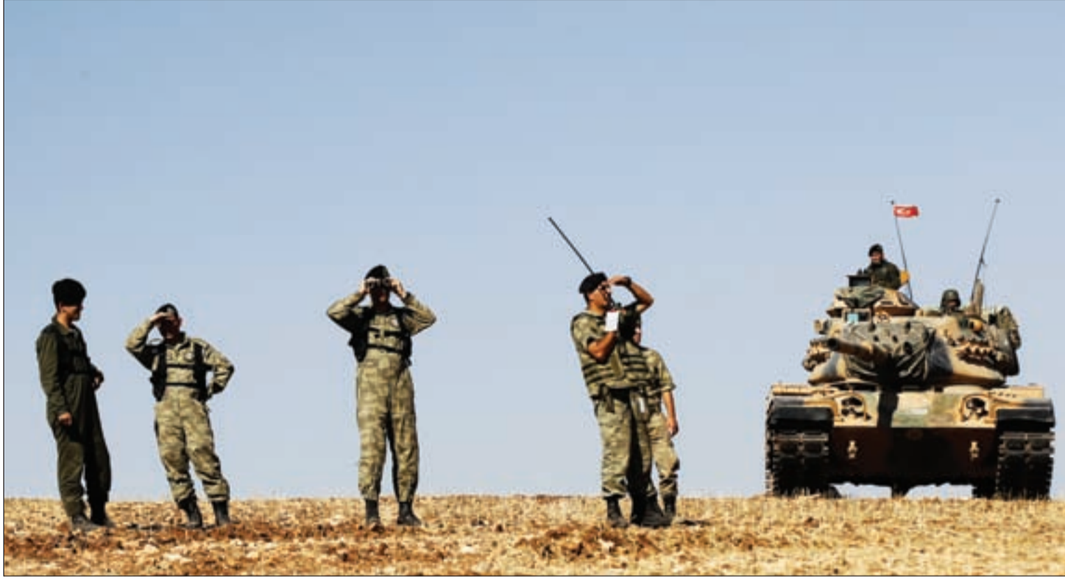
تركيا تعيش أسوأ مآزق في تاريخ حزب العدالة والتنمية،

يعيش الرئيس التركي رجب طيب أردوغان لحظات انهيار حلمه التاريخي بولادة «الخلافة التركية الحديثة»، ولو جزئياً في العالم العربي وبعض الدول الإسلامية. بالتعاون مع العدو «الإسرائيلي» وحلف «الناتو»، بعد خمس سنوات من التخریب في ما يسمى «الربيع العربي»، وبعد وصول أردوغان إلى مشارف «الخلافة» وإعلان مرحلتها التجريبية بإعلان «دولة الخلافة» عبر «داعش» كبت تجريبي كمرحلة أولى، تمهد لمصادرة «خلافة داعش»، وتغيير اسمها لـ «الخلافة العثمانية» أو «الخلافة التركية الحديثة».