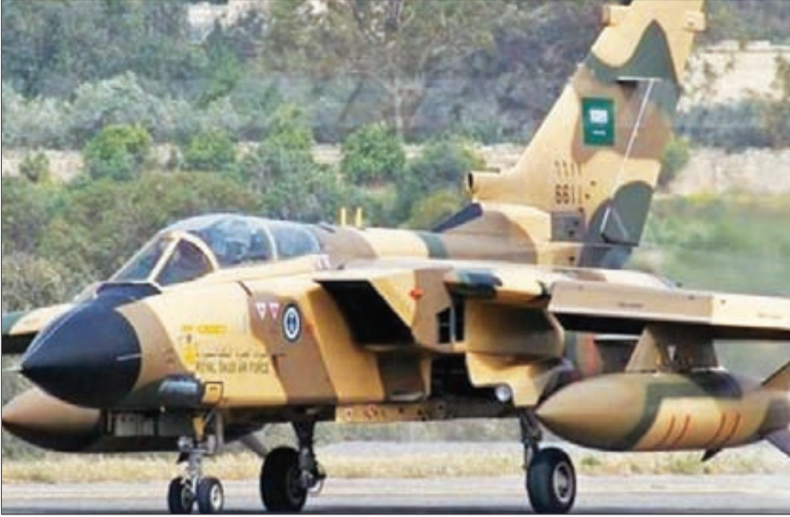
روسيا لن تقبل بأي عمل عسكري من دون تنسيق مسبق معها

أجل طرد «داعش» من المناطق التي يحتلها، لتحسين موقعها التفاوضي، أم أنها ستكتفي بالغارات الجوية التي لم تؤد غرضها، بسبب عجز المعارضات «المعتدلة» عن مواجهة «داعش»؟ وهل ستقبل روسيا بالدخول البري لتركيا والسعودية اللتين تعملان على إسقاط النظام وتدعمان الإرهاب التكفيري لهذه الغاية؟