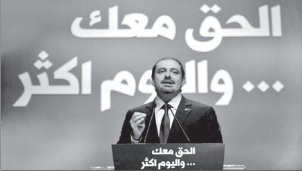
الرئيس سعد الحريري يلقي كلمته في البéal

العام 2017، منعاً لحدوث فتنة سنية - شيعية؛ وهنا مكن قوة الحريري ونومه على حرير حتى العام المذكور! رابعاً: في دعوته النواب للنزول إلى المجلس وانتخاب رئيس مادام هناك ثلاثة مرشحين (فرنجية وحلو وعون)، فهو يدرك أن وصول فرنجية بشروط حريرية للعودة إلى السراي مدة ست سنوات، أمر مرفوض سورياً، ومرفوض لبنانياً، أولاً بسبب التورط في التحريض على دولة جارة، وتزويد الإرهابيين بالأسلحة المغلفة بالحفاضات وعلب الحليب، وثانياً بسبب موقف الحريري - المطلوب سعودياً - بحق المقاومة. وإذا كان ترشيح النائب هنري حلو لا يعدو كونه دعاية - مباحكة جنبلاطية، فإن تزكية العماد عون ممنوعة ممنوعة، لأنها تكرر الهزيمة القاسية لحركة «14 آذار» وداعميها الإقليميين، الذين أختنهم الهزائم، سواء في العراق أو سورية أو اليمن، ونواب الحريري حالياً مجرد ودائع في خزائن المملكة، وأعلى من كل أسلحتها بمواجهة إيران. خامساً وأخيراً: إذا كان الرئيس الحريري يعتبر أن «الحريرية السياسية» تعيش في ضمائر اللبنانيين كمدسة، ومادام الاستفتاء الشعبي لا ينص عليه الدستور اللبناني، ومادام حجم البعض انكفاً من الساحات إلى القاعات، فهي الانتخابات البلدية على الأبواب، وسيقرأ الرئيس الحريري في نتائجها أسباب غياب أبناء عكار والشمال وبيروت والبقاع وصيدا عن ساحات الاستعراضات و«خلع القمصان»، بعد أن انتفت ذريعة أن تكون الشهادة «قميص عثمان»، وستكون أصوات اللبنانيين واضحة وصاعقة في صناديق الاقتراع، تماماً كالعبارات التي كتبت علناً في صيدا على صور الرئيس «الشهيد».