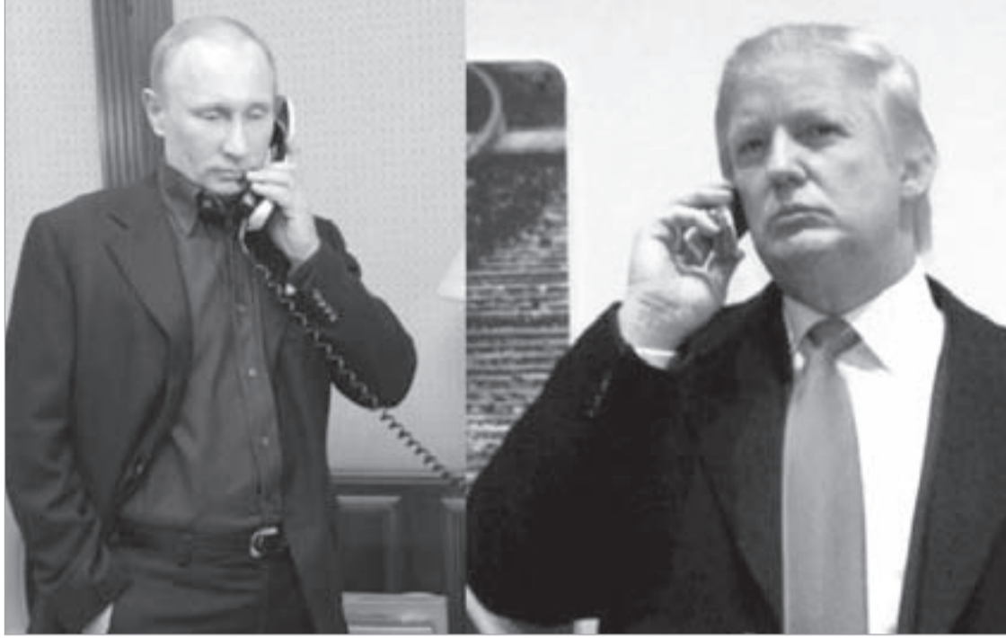
بين ترامب وبيوتين.. ما هو مصير العلاقات الروسية - الإيرانية؟

تستطع الولايات المتحدة إخضاعها على مدى أربعين عاماً.