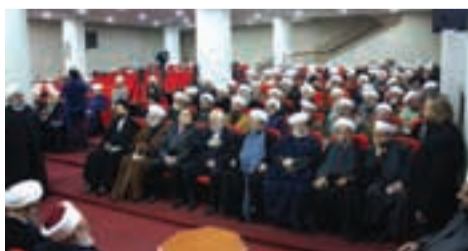
جانب من الحضور في مقر تجمع العلماء المسلمين

والسامية المتخلفة، وللقضية الفلسطينية، وإيران اليوم هي من البلاد القليلة جداً التي تقف إلى جانب القضية الفلسطينية، وترفض الاعتراف بـ«إسرائيل». وأشارت الكلمات إلى نظرية «الإسلام دين ودولة»، و«بتنا نقول لكل المشككين: «انظروا هذا هو الإسلام.. بني دولة عصرية رائدة في كل مجالات الحياة ومواكباً لكل تطورات التقنية والنظم الاجتماعية والاقتصادية والسياسية.. دولة عصرية تدحض كل ما جنت به من افتراءات وتهكم بأنها دولة التخلف والرجعية ودينا هذا التطور العلمي الباهر في إيران الإسلام من النانو تكنولوجيا إلى الطاقة النووية».