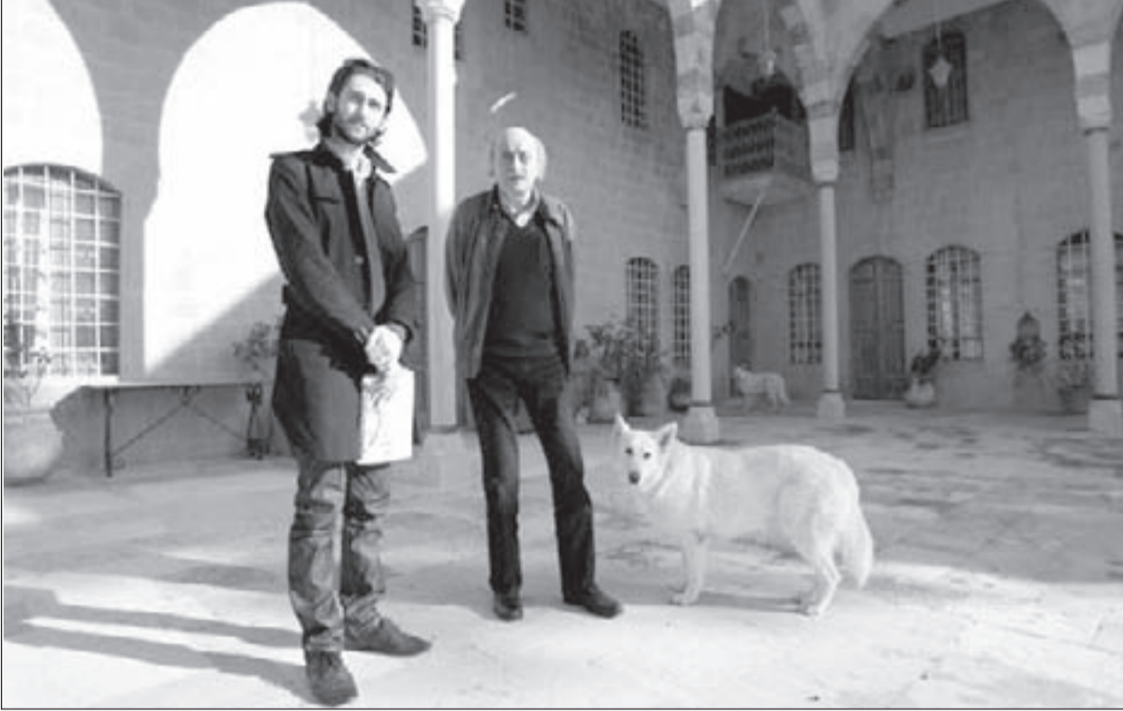
التوريت السياسي العائلي عائق أمام الوصول إلى عموم الوطن والزعامة الوطنية

كسروان وكازينو لبنان، إلى كل مشروع يعتاش منه اللبنانيون مناطقياً وهو تحت رحمة البيك أو الزعيم أو الشيخ، مما يجعل «العائلات السياسية» غير راضية عن إلغاء الستين، وتمسكة بالقضاء دائرة انتخابية، وأقصى ما ترتضيه هذه «العائلات المنطقية» ذات «البيوتات السياسية» هو القانون الأكثر، الذي هو لصالح الأقوياء، نتيجة امتلاكهم القدرات و«الأملك الخاصة»، والناخب شاء أم أبى هو جزء من أملاكهم، ماداموا يملكون أرضه ورزقه وتعليم أولاده وتوظيفهم، وإرسال أكالييل عند دفن موتاهم. رغم كل محاولات تقطيع الوقت لشراء المهل، فإن القانون النسبي يسلك طريقه بتوافق القوى الحزبية ذات الحجم الشعبي الوازن، رغم أن هذه الأحزاب قد تخسر جزئياً بهذا القانون، لكنها تسعى لاستقرار اجتماعي، من خلال إتاحة الفرصة للأقليات «المعارضة للأحزاب» عبر تمثيلها ضمن حجمها، وإذا كانت «خصوصية الجبل» محترمة لدى الأقطاب الآخرين، فهي لطمأنة أبناء الجبل كأقليات، ولن تكون لطمأنة زعامة معينة على حسابات أطراف أخرى ضمن الطائفة الواحدة، لأن المعركة النيابية في لبنان تتأثر بالحيثيات المستجدة، ومن خسر في السويداء السورية والجولان المحتل، وفي كافة الرهانات الإقليمية، وتحديداً في سورية، لن يستطيع إقصاء من انتصروا وباتوا جزءاً من معادلة محور المقاومة، و«الخصوصية العائلية» عند أي كان باتت تنعكس سلباً على زعامة أصحابها، وستكون العائق للوصول إلى عموم الوطن والزعامة الوطنية.