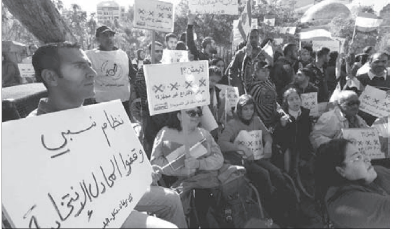
تغيير قانون الانتخابات حاجة ملحة لتطوير النظام السياسي.. ولوضع حد لاحتكار التمثيل النيابي

متهم بأنه يستولي على تمثيل اللبنانيين، عبر قلة من الحاشية والمستفيدين، مقابل أكثرية يدفعها القانون الأكثرية للاعتكاف عن الحضور إلى صناديق الاقتراع، والمحطات الانتخابية تشهد كيف يقوم الزعيم الغلاني بالرفع لشخص مغمور لكي يترشح ويشتهر أصوات أخصامه، بل وتشهد كيف أن من يشن حرباً على قانون النسبية يبكي مؤيدوه، الذين يدعي تمثيلهم، خلف الجدران قائلين: «يا حزني سياج الطائفة منو منها»، أو زعيم العاصمة غريب عنها، لأنه مفروض عليهم فرضاً، لأسباب تاريخية وسياسية ومالية، ترتبط بوجود الإقطاع القديم والإقطاع المالي - السياسي الجديد.