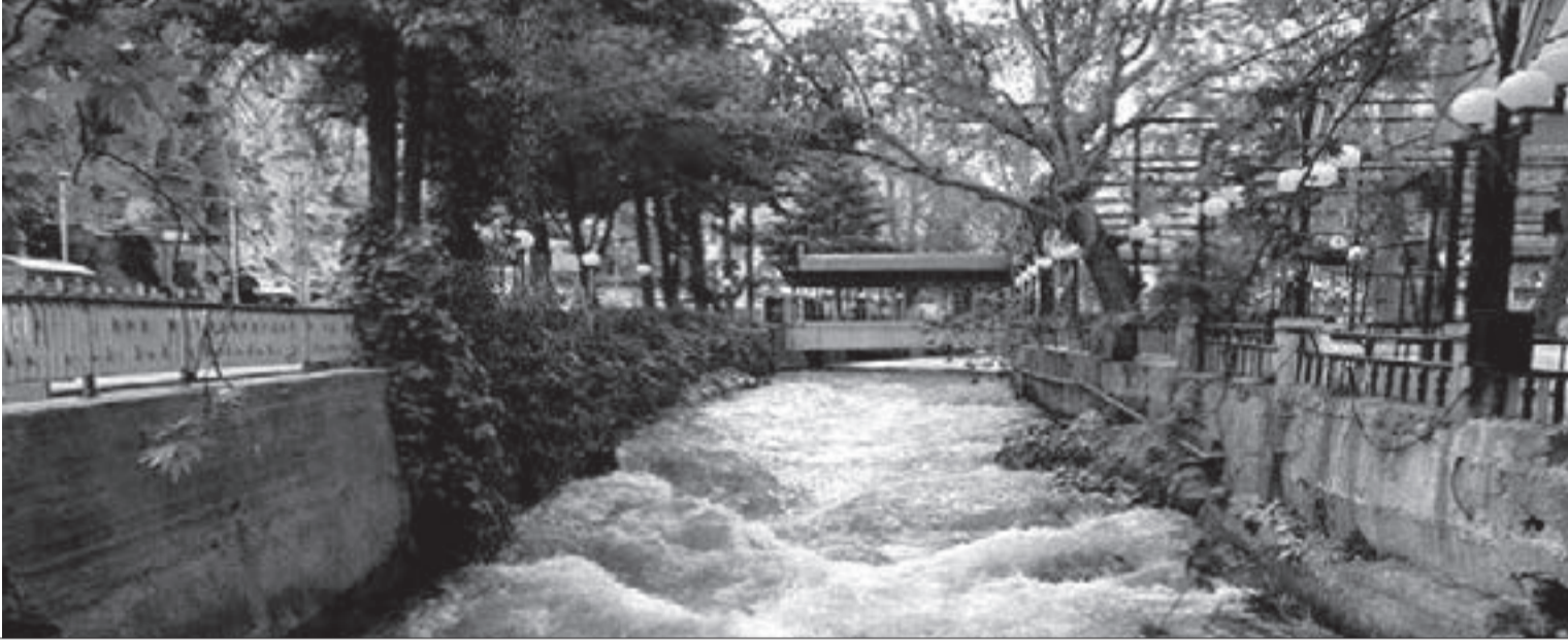
المياه بدأت تعود لمجاريها بعد تحرير الجيش السوري لمنطقة عين الفيحة بريف دمشق

لم يترك الإرهابيون التكفيريون المدعمون من الأميركيين والصهاينة والغرب وبائعي الكاز العربي والنظام التركي وسيلة إلا واستعملوها من أجل تفكيك سورية، وتجويع وتعطيش شعبها، وتدمير تاريخها وسرقة آثارها التاريخية العريقة.