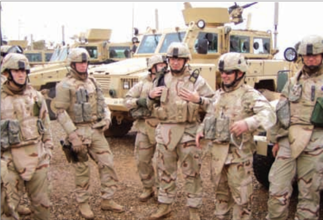
محاكمة «داعش» هي المعركة الأسهل نسبياً على ترامب

على المقاتلين الأكراد في استراتيجتهم لمكافحة الإرهاب، بعدما فشلت كل البرامج العسكرية التدريبية للاعتماد على مقاتلين سوريين «معتدلين»، بالإضافة إلى ارتباط الانتهاز من ظاهرة «داعش» بالتعاون مع الجيش السوري وحلفائه، وعدم رغبة الأميركيين بالانتهاء من تلك الظاهرة قبل الاتفاق على مستقبل وترتيبات ما بعد الحرب في سورية.. كل هذا، قد يؤجل السعي الأميركي للقضاء على «داعش» في سورية أو إلى حل النزاع السوري، خصوصاً أن القبول بالأمر الواقع وإنهاء الحرب السورية قياساً على موازين القوى الميدانية، قد يعطي مادة دسمة للمعارضين في الداخل لانتقاد ترامب، وستكون عناوين الحملة الإعلامية والسياسية عليه: القبول ببقاء الأسد، أو التعاون مع «متهمين» بارتكاب مجازر، أو التخلي عن حلفائنا، أو تعظيم دور إيران وحزب الله في المنطقة..