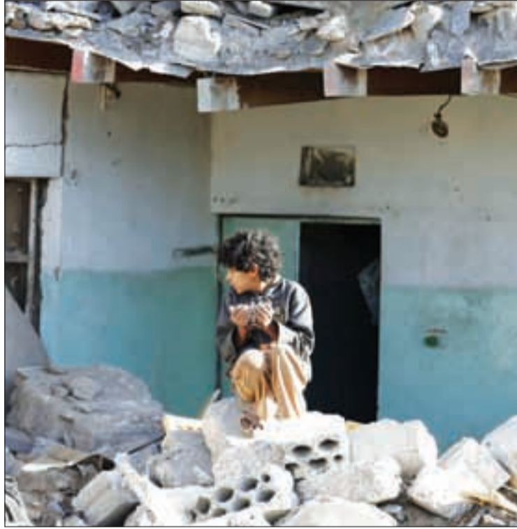
طفل يلهج بالدعاء إثر قصف الطائرات السعودية عائلته في العاصمة صنعاء

قد يقول البعض إن الخسارة اليمنية فادحة ولا تعوض طيلة عامين من القصف والقتل، والتي أعادت اليمن إلى ستينيات القرن الماضي نتيجة تدمير البنى التحتية، مع عشرات آلاف الجرحى والشهداء والفقر والجوع، وهذا صحيح بسبب همجية العدوان، لكن الجواب أن اليمنيين كانوا ضحايا العدوان ولم يبدأوا بالقتال، إلا